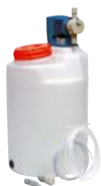
Art.nr 41330 Flockningsstation inkl. kärl 60 l och pump.