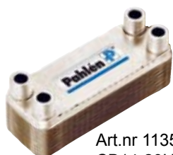
Art.nr 113510 CB14-20H