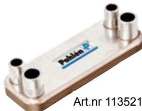
Art.nr 113521 CB27-24M