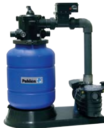
Komplett anläggning med filter, pump och elvärmare.